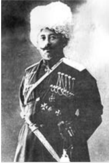
Генерал Баратов Николай Николаевич

Считается, что с распадом фронта турки осуществляли полный контроль над северо-западными районами Персии. На самом деле ситуация не была столь однозначной. Часть Российской армии, представленная казачьими отрядами под командованием генерала Николая Баратова, отказалась подчиняться приказам правительства Керенского и большевиков. Генерал Баратов взял на себя полное командование Кавказским фронтом и продолжал успешно противостоять туркам с июля 1917 года, когда начался вывод российских войск, до окончания войны. Именно