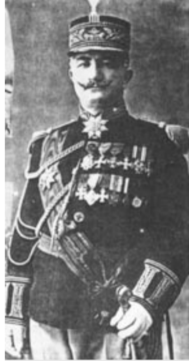
Генерал Ага Путрус Элов

Все эти данные дают основание предположить, что в тяжелейший для ассирийцев период июля-августа 1918 года исход из Урмии