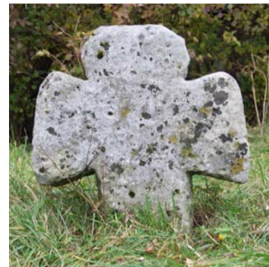
Каменные несторианские кресты до сих пор стоят на старых казацких могилах.

Узбека часть верующих Церкви Востока из Золотой Орды переселилась в Московскую Русь и перешла в православие, часть поселилась в пограничной степной зоне между Ордой, Русью и Великим Княжеством Литовским (позже Речью Посполитой), где со временем также ассимилировалась сре-