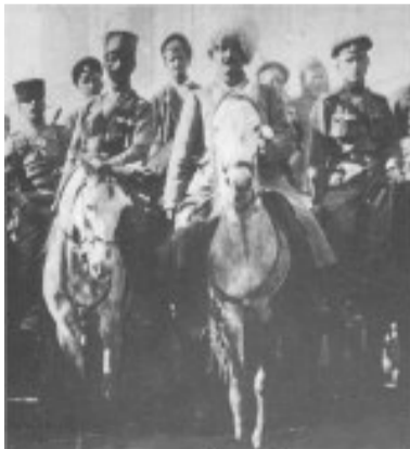
Assyrian General, Agha Petros

До 20 века Святая Апостольская Соборная Ассирийская Церковь Востока называлась в основном Церковью Востока (некоторые учёные именовали её “несторианской”, другие, такие как проф. В.В. Болотов (1853 - 1900), называли