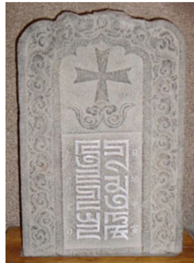
Несторианские надгробные памятники начала 14 века из Гуанчжоу (Южный Китай), с сайта http://babelstone.blogspot.com/2006/11/christian-tombstones-of-zayton.html

В начале XIII в. христианские ханства Центральной Азии были завоеваны монголами Чингиз-хана и несторианство, наряду со старой монгольской религией, стало одним из основных вероисповеданий новой империи. Сыновья Чингиз-хана были женаты на христианках: Угедей – на меркитке Туракине, Толуй – на кераитской царевне Сорактами-бэги. В ханской ставке, Каракоруме, были построены христианские церкви. Сын Толуя Ариг-буга, по свидетельству западного путешественника Рубрука, от-